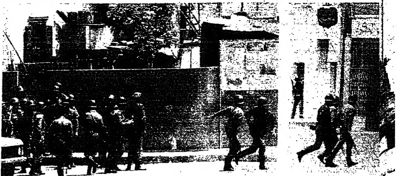
الشرطة يسارعون لخط مراكزهم ■ مجموعة من رجال «الفرقة ١٦» لدى وصولهم الى الكرنيتا أمس ■